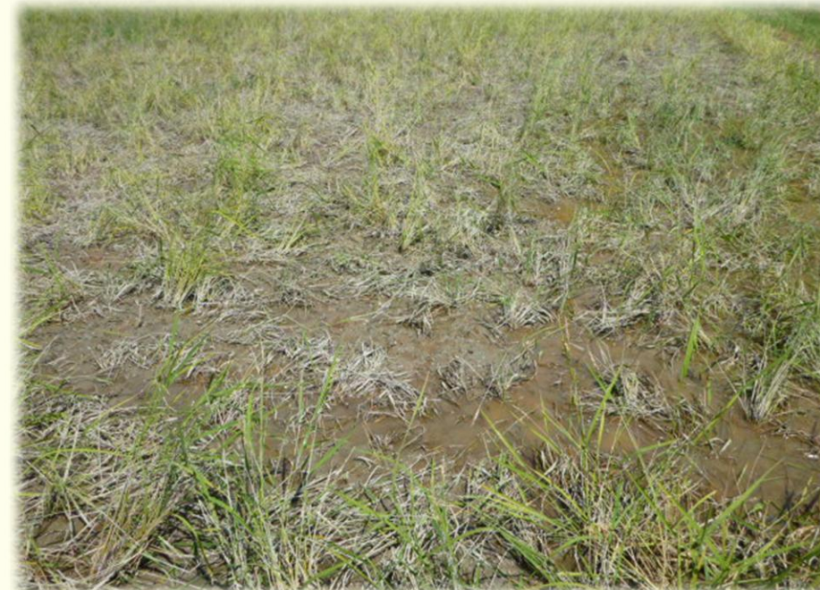
猪により被害を受けた圃場

風水害・干害・冷害・地震害・火災・病害・虫害・ 鳥害・獣害・その他気象上の原因による災害