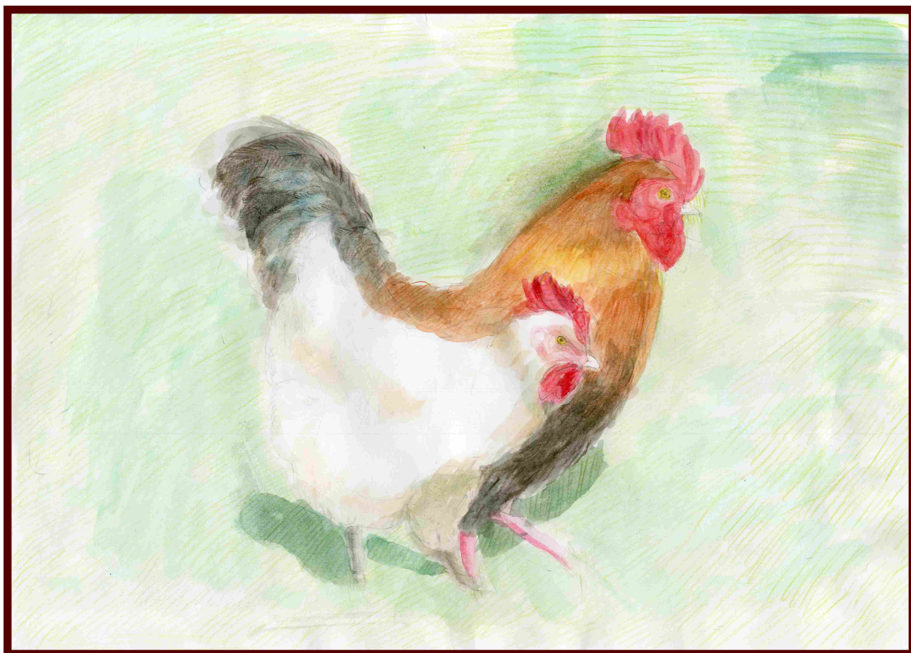
「庭にいる2羽のにわとり」