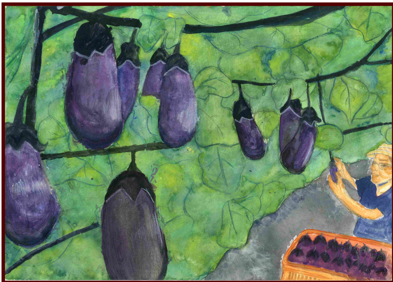
「おじいちゃんのなすび！！」