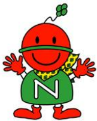
NOSAI 滋賀マスコットキャラクター「ノンちゃん」