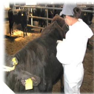
～R5年受入れ時の実習の様子～

家畜診療所では、一人でも多くの実習生が大動物臨床の現場に帰ってきてくれることを期待しています！