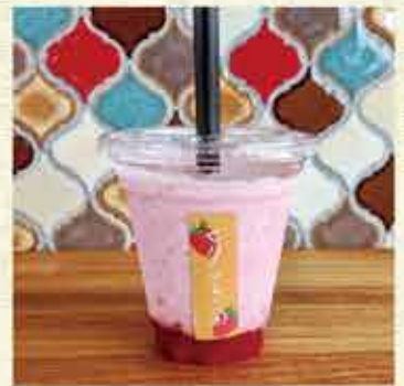
テイクアウトのイチゴミルク

豊かな緑、真っ赤なイチゴと青い湖。コントラストの美しさに包まれてみませんか。お一人様、カップル、ファミリーで存分に堪能できます。 また、天の川の七夕伝説が伝わる近隣の蛭子神社は、恋愛成就のパワースポットとしても知られています。今後はハウスを増設し、「七夕いちごカフェ」での貸切りイベントや婚活パーティなどの街コンも検討中です。 自転車スタンドや駐車場、トイレも完備され、ピワイチ（自転車で琵琶湖一周）やツーリングにも対応しています。