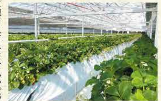
太陽発電とLEDでコストを抑える栽培システム