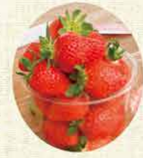
おいしいイチゴをどうぞ

豊かな緑、真っ赤なイチゴと青い湖。コントラストの美しさに包まれてみませんか。お一人様、カップル、ファミリーで存分に堪能できます。 また、天の川の七夕伝説が伝わる近隣の蛭子神社は、恋愛成就のパワースポットとしても知られています。今後はハウスを増設し、「七夕いちごカフェ」での貸切りイベントや婚活パーティなどの街コンも検討中です。 自転車スタンドや駐車場、トイレも完備され、ピワイチ（自転車で琵琶湖一周）やツーリングにも対応しています。