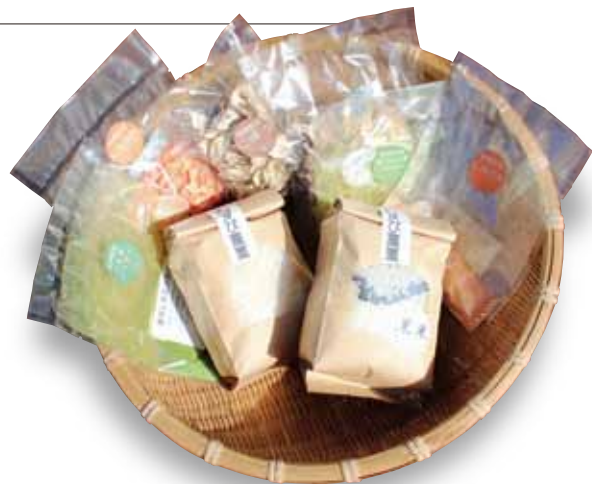
こだわり米と乾燥加工された野菜のチップとパウダー

農業技術の向上や作業の効率化を図り、規模拡大により、米、野菜の複合経営を目指しています。