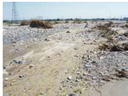
土砂が流入した水田（高島市）