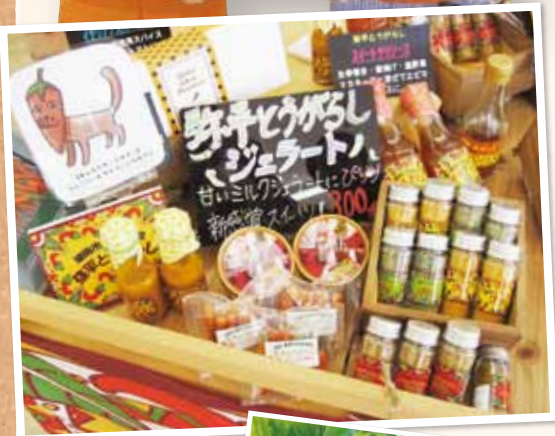
甘いのに辛〜いジェラートなど楽しい商品がいっぱい