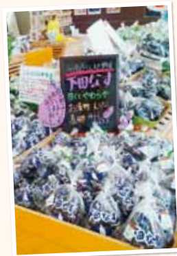
下田ナスの新鮮なおいさを味わえる