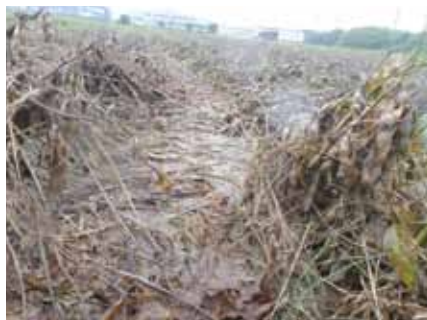
土砂が流入した大豆ほ場（高島市）