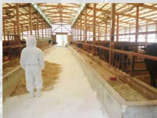
台風18号で土砂流入した牛舎の消毒作業

家畜共済の死産事故については、乳牛の雌等の事故は168頭、前年対比73.7%（60頭の減）支払共済金は、1,943万、