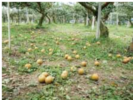
強風により落下した梨（竜王町）