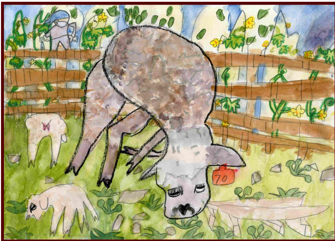
「きゅうり畑とひつじたち」