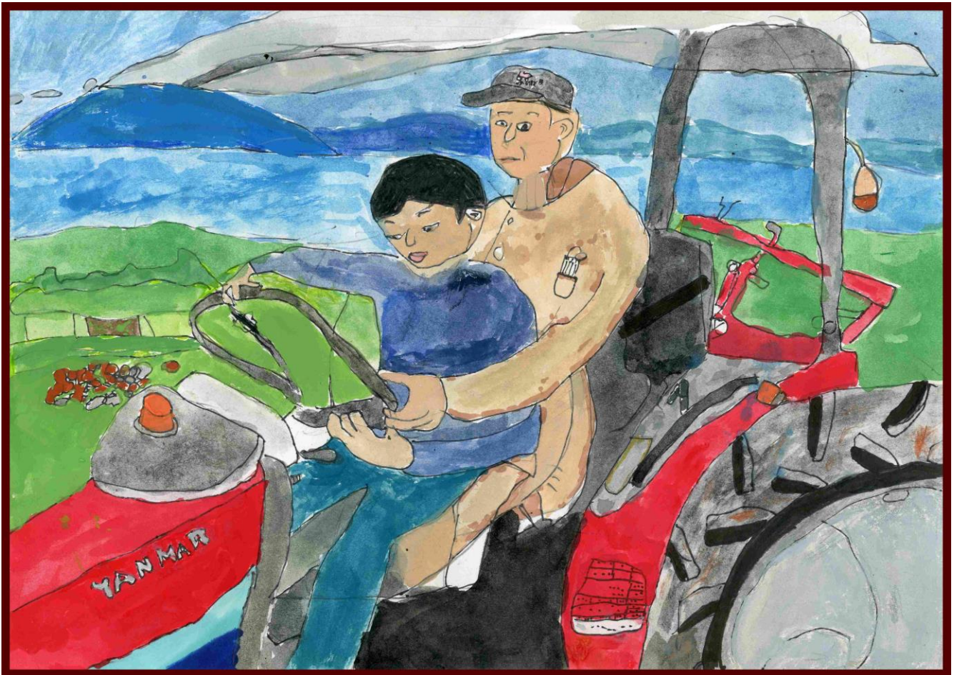
「おじいちゃんとトラクター」