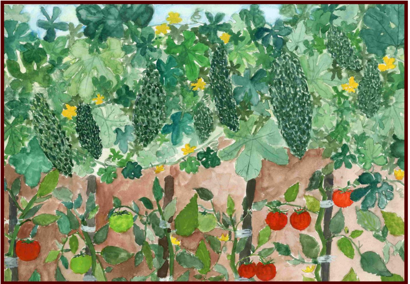
「おじいちゃんの畑」